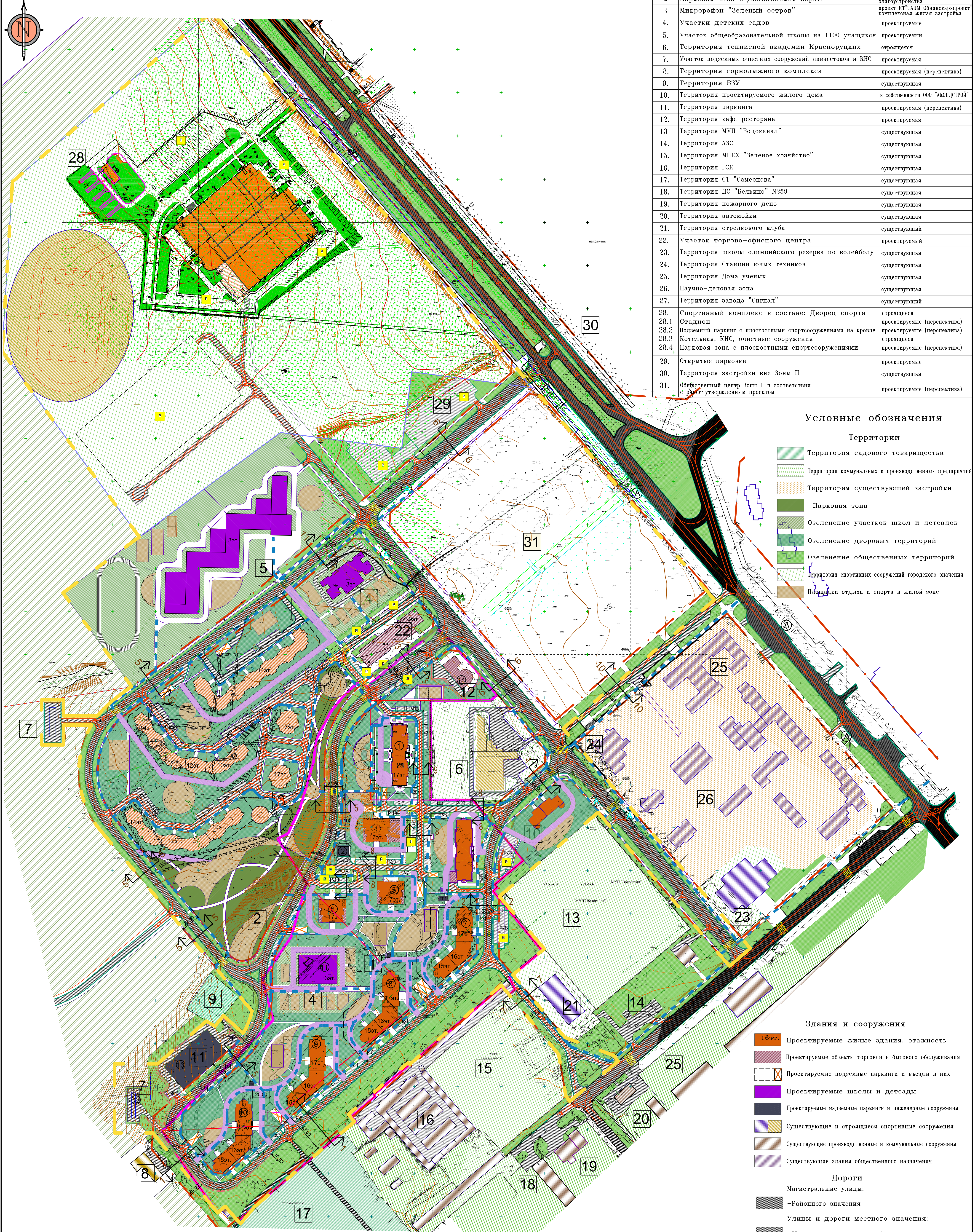
Схема организации улично-дорожной сети и движения транспорта М 1:2000